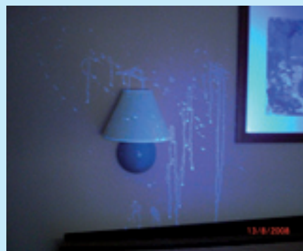
... met behulp van ledlicht is echter zichtbaar dat de muur alles behalve schoon is.